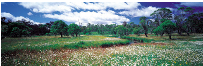
1 Wohlfühlen oder Nicht-Wohlfühlen im Gebäude

Es gibt aber auch Gebäude in denen fühlt man sich wohl, wenn man auf sie zugeht und sie betritt. Man ist gerne dort und gerät in eine positive Stimmung. Werden einem diese Gebäude vertraut, wird dieses positive Gefühl noch verstärkt und bestimmte Wahrnehmungen in ihnen wirken als Schlüsselreize für Wohlbefinden. Viele von uns denken darüber nicht nach, vielen sind diese positiven und auch negativen Gefühle nicht einmal bewusst.